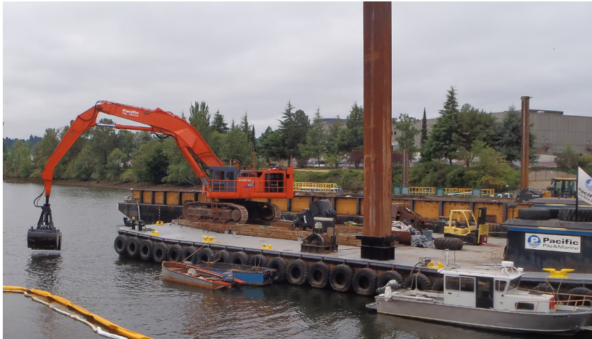
កុត្តរដើម្បីប្រយោជន៍ ANCHOR QEA

គ្រឿងចក្រដឹកដីប្រភេទអ៊ីដ្រូលីកកាយយកដីល្បាប់កខ្វក់ចេញពីបាតទន្លេ។